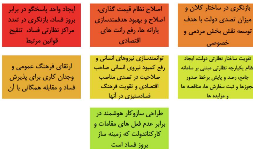
شکل ۲؛ اقدامات کلیدی و بنیادین (بلندمدت دولت در زمینه مبارزه با فساد)

بر این اساس (اصول هشت‌گانه و سیاست‌های اجرایی) اقدامات کلیدی و بنیادین (بلندمدت)، اقدامات عملیاتی (میان‌مدت و کوتاه‌مدت) تعریف شده است. اقدامات بلندمدت اصلاحات ساختاری مورد انتظار است که پس از اجرایی شدن اقدامات کوتاه‌مدت و میان‌مدت انتظار می‌رود حاصل شود. به عبارتی این دسته به‌عنوان پیامد اجرای اقدامات میان‌مدت و کوتاه‌مدتی است که توسط دستگاه‌ها و سازمان‌های دولتی اجرا خواهند شد. بنابراین اقدامات میان‌مدت و کوتاه‌مدت، کارکردهای اصلاحی است که ۱۷ نهاد و سازمان دولتی ملزم به اجرای آن هستند.